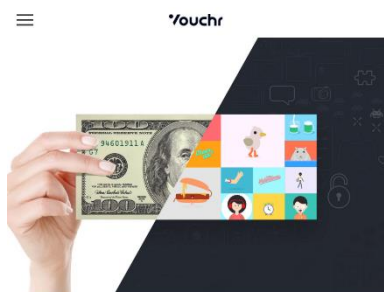
The world's first consumer experience platform for digital money.

Les acteurs traditionnels, qui arrivent tardivement sur le marché, doivent se plier à des usages imposés par une autre génération de fournisseurs qu'ils ont du mal à appréhender. Vouchr est là pour les aider à s'aligner, mais laisse entière la question de la cohérence entre ces approches et le reste des services de la banque. EN SAVOIR+