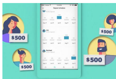
Yahoo Finance launches social savings app Tanda, an alternative to credit cards.