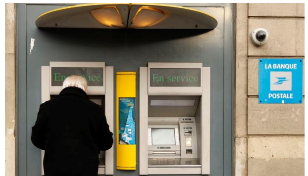
Le Figaro • 21.01.2015 • Cognac DAB généreux