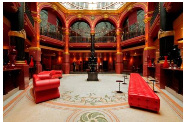
Paris Zigzag • 19.11.2014 • Passez une nuit dans une banque • Hôtel Banke

Alors si vous rêvez de passer vos nuits dans une banque, profitez de ces fêtes de fin d'année pour le faire dans un cadre raffiné et pour troquer vos plateaux-repas contre une cuisine méditerranéenne aux influences contemporaines !