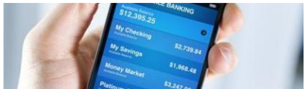
Cbanque • 08.09.2014 • Banque sur internet et mobile

Selon une étude menée par CCM Benchmark, concernant l'usage de la banque en ligne par les Français, plus de 96% des clients interrogés affirment avoir consulté au moins une fois leurs comptes en ligne (internet, mobile et tablette) lors des six derniers mois. Sur cette même période, 67% d'entre eux ont réalisé un virement interne sur internet contre 51% sur mobile, seulement 1% ont souscrit à un produit bancaire ou d'assurance sur mobile alors que cette proportion grimpe à 21% sur internet, principalement pour des ouvertures de produits d'épargne (CEL, PEL, LDD, etc.) et de comptes courants.