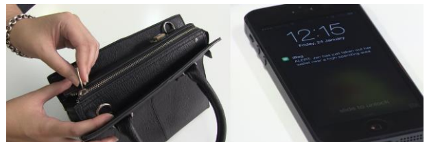
Le Point • 11.02.2014 • Un sac intelligent pour éviter les dépenses inutiles

Il est aussi possible de paramétrer l'iBag pour se verrouiller à la demande lors de périodes "dangereuses" comme aux pauses de midi et à l'heure de sortie des bureaux. Pour l'instant, un seul modèle femme est disponible.