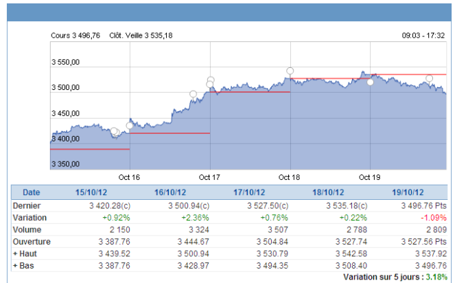
Boursorama : Evolution du CAC40 à 5 jours Mis à jour le 19.10.2012 à 17h37