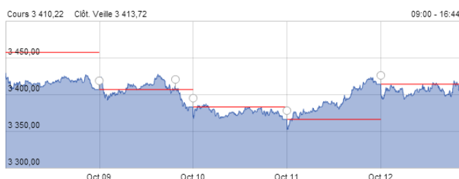
Boursorama : Evolution du CAC40 à 5 jours Mis à jour le 12.10.2012 à 17h40