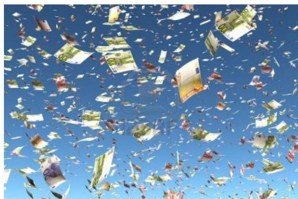
Le Figaro • 26.04.2013 • Une pluie de billets s'abat sur un village belge

Seule une infime partie du butin a été rendue par les citoyens (11 000 euros sur plusieurs millions) malgré les appels du Maire à « se comporter en honnêtes gens et non pas en voleurs »...