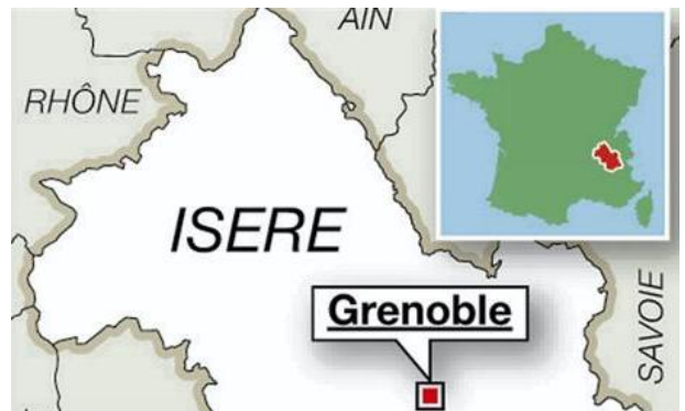
Ouest France • 19.06.2013 • Les policiers croyaient à un braquage... C'était un tournage !

Histoire de ne pas avoir fait le déplacement pour rien, les policiers ont mis un PV aux rappeurs car l'un des pneus de la Mercedes était lisse .