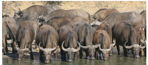
Direct CD • 13.05.2013 • « La banque qui ne prête pas d'argent ... mais des buffles »

Depuis, une centaine de banques prêtent des buffles aux villageois, pour une durée de trois ans : le temps pour les fermiers d'avoir des naissances et d'augmenter leurs revenus. En échange de ce prêt, les agriculteurs cèdent à la banque la première femelle née, laquelle pourra ensuite être prêtée à son tour. 33 000 buffles sont ainsi déjà passés de ferme en ferme.