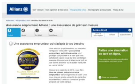
L'Argus de l'assurance • 14.11.2013 • Assurance emprunteur : Allianz lance une offre simplifiée

options proposées permettent le remboursement du capital restant dû en cas de cancer, d'infarctus, d'AVC ou d'autres maladie grave, ou encore des services d'assistance en cas de perte d'emploi.