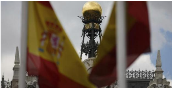
La tribune • 15.11.2013 • L'Espagne n'a plus besoin d'aide européenne pour sauver ses banques

Selon les ministres des Finances de l'Eurogroupe l'Espagne sortira officiellement en janvier prochain du programme d'aide pour les banques. Pour faire face à la crise, l'Espagne avait en effet bénéficié en 2012 d'une aide de 100 milliards d'euros dont seuls 41,3 milliards d'euros ont finalement été utilisés.