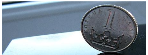
Ouest France • 04.12.2013 • Insolite. Il braque une banque, rembourse sa dette puis se dénonce

L'homme, ayant eu une conduite irréprochable jusqu'à présent reste libre le temps de l'enquête mais encourt une peine de 2 à 10 ans de prison.